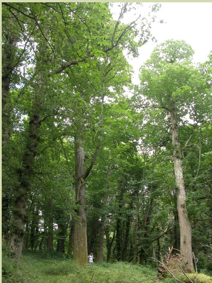
Fraga de Catasós (2003)

A fraga é un bo lugar para unha visita puntual, para un curto percorrido, sen ir máis alá dos límites da parcela; para deixarse levar polos camiños entre os arboredos dos arredores, ou para facer un roteiro seguindo a sinalización de Fragas de Catasós (indicado cunha folla de carballo de cor verde cunha frecha inserida para sinalar a dirección da marcha), que nos leva polas masas de bosque e polos lugares da contorna ata completar un percorrido de 6 a 7 km. No traxecto imos atopar ademais algúns bos exemplares de sobreira, que conservan as pegadas de vellos aproveitamentos da cortiza, e ao saír do bosque as paisaxes da contorna, praderías rodeadas de sebes nas que sobresaen os toros brancos dos bidueiros, entre o gris dos ameneiros e os carballos que durante o verán dan sombra ao gando.