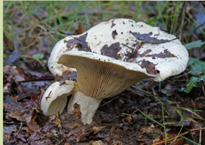
Lactarius vellereus , un cogomelo que pode superar os 20 cm de diámetro. O outono tamén é tempo de cogomelos dos que atoparemos un amplo mostrario camiñando polo bosque.