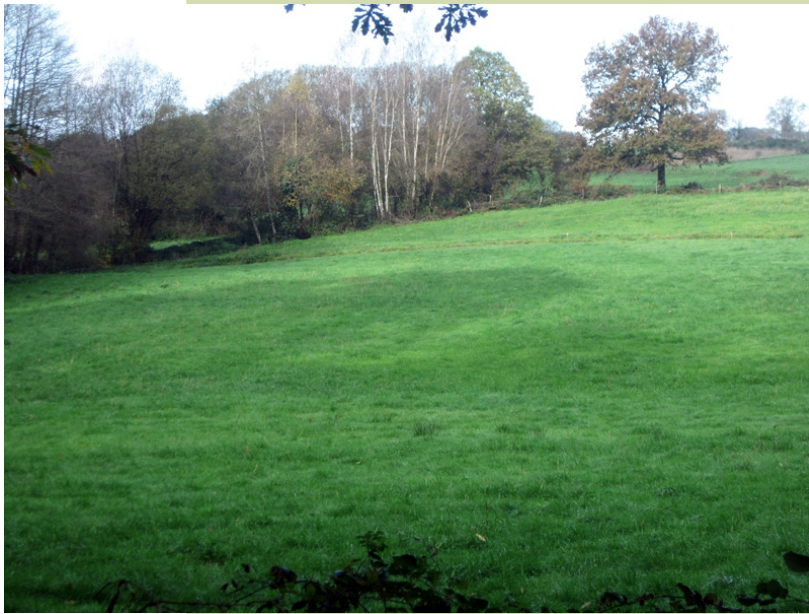
Prados na contorna da fraga