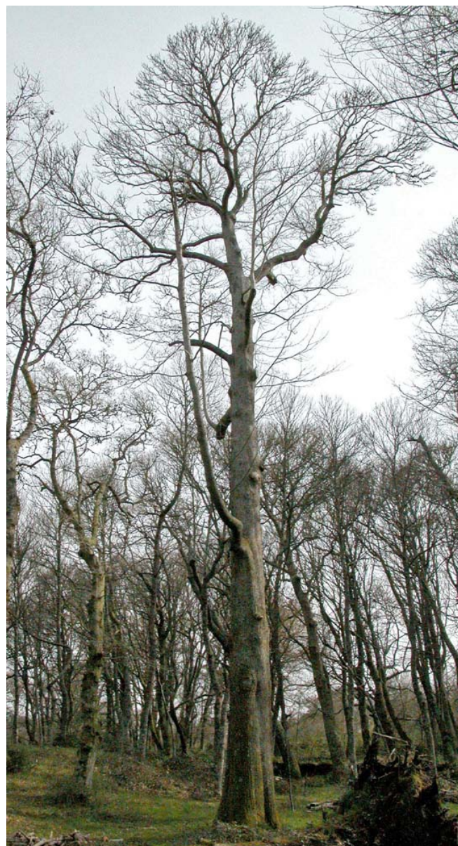
O castiñeiro máis grande que se conserva (imaxe de 2004). Ten arredor de 30 m de altura e 4,40 m de perímetro.