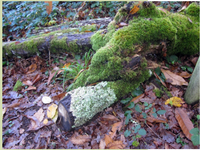
Liques e brións