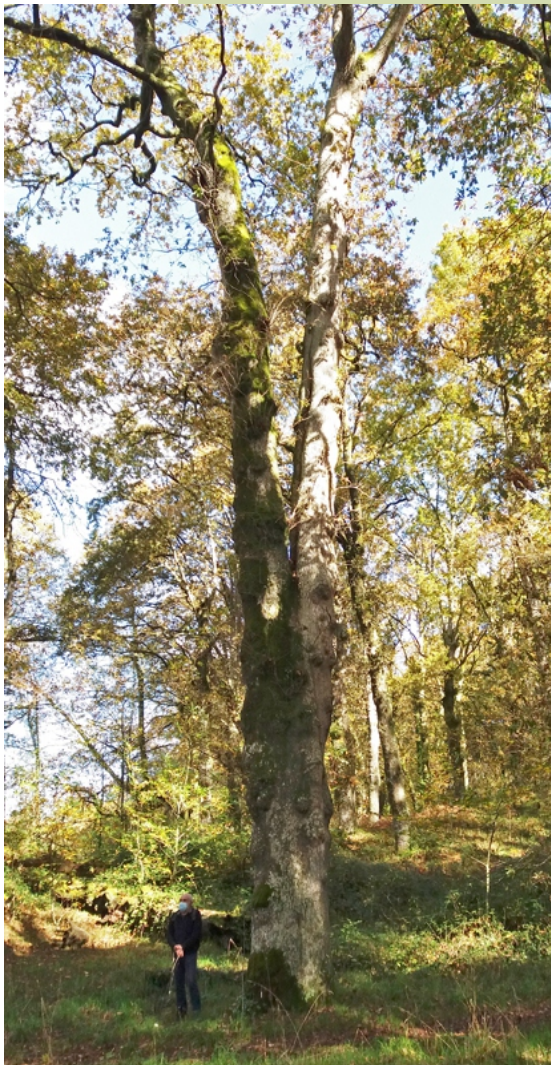
Carballos. O máis grande ten 3,85 m de perímetro.