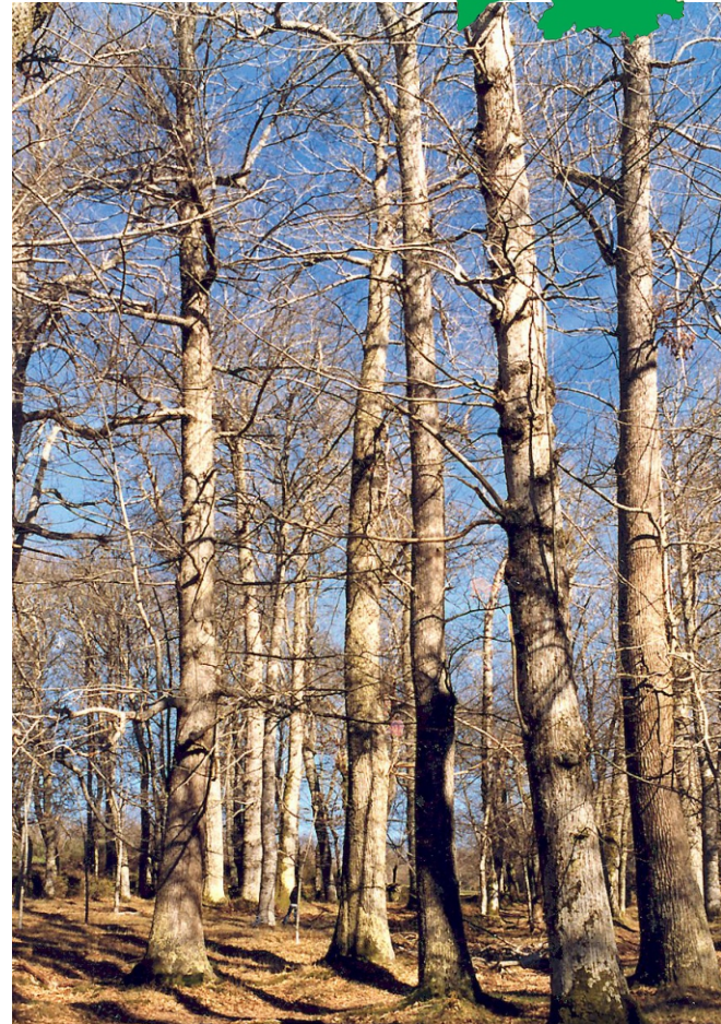
Fraga de Catasós (1979). Algún dos castiñeiros xa non existe.

A fraga de Quintela de Catasós, chamada tamén Carballeira ou Souto de Quiroga ou de Quintela, é unha pequena superficie de bosque autóctono asentado na aba arborada do val do rego de Quintela a unha altitude duns 550 m sobre o nivel do mar. O seu maior interese reside no grande valor biolóxico dos castiñeiros que teñen o fuste máis alto de Europa (sobrepasan os 30 m de altura, con case 5 m de perímetro na base e uns 300 anos de idade). Na década de 1970 foron considerados pola FAO como os de mellor porte forestal de