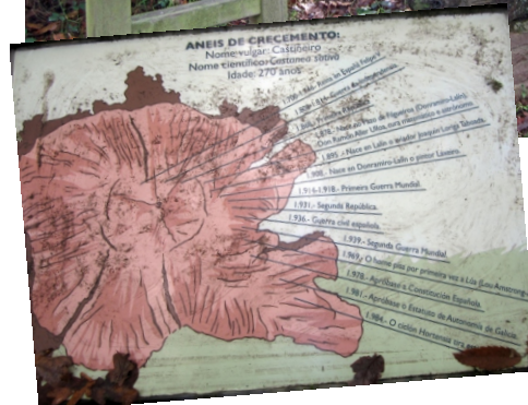
Toro dun dos castiñeiros caídos, cunha gráfica das datas de interese