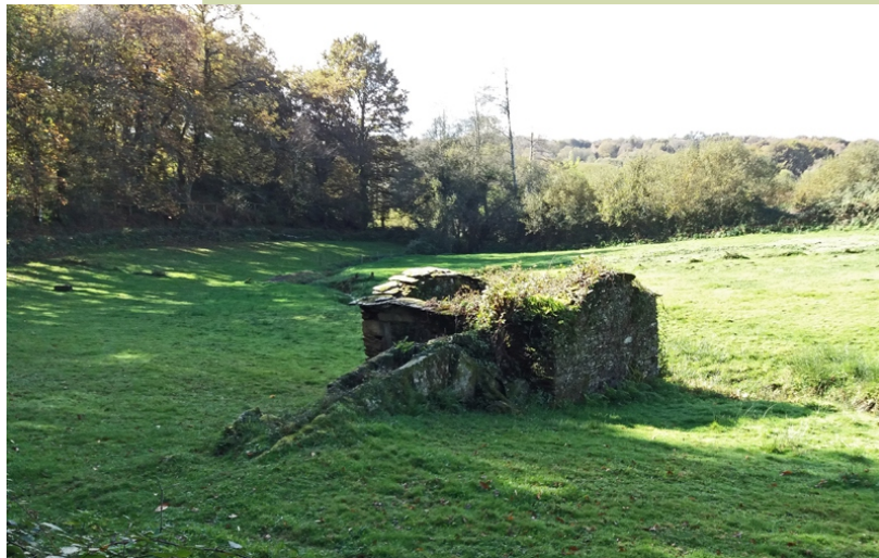
Muíño no rego de Quintela, un afluente do Asneiro (Deza)