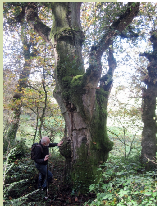
Sobreira 3,80 m de perímetro